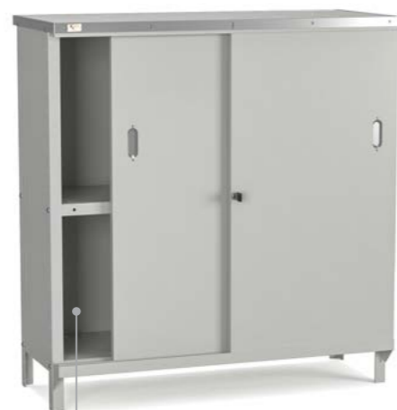
BALCÃO COM PORTAS DE CORRER