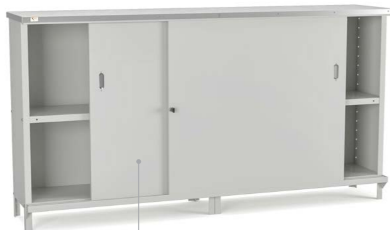
BALCÃO GRANDE COM PORTAS DE CORRER

Dimensões do produto: Alt. 980 mm Larg. 925 mm Prof. 300, 420 ou 580 mm Prof. do tampo 380, 500 ou 680 mm