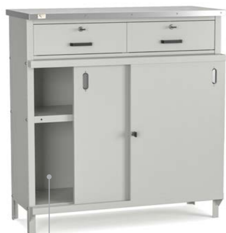
BALCÃO COM PORTAS DE CORRER E GAVETAS

Dimensões do produto: Alt. 980 mm Larg. 925 mm Prof. 300, 420 ou 580 mm Prof. do tampo 380, 500 ou 680 mm